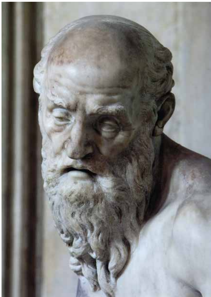
7. Parigi, Musée du Louvre, Anonimo, Busto virile, particolare , sec. XIX.