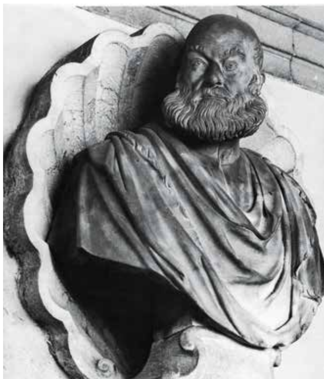
9. Venezia, Chiesa di San Sebastiano, cappella Grimani, Alessandro Vittoria, Busto di Marcantonio Grimani , 1557.