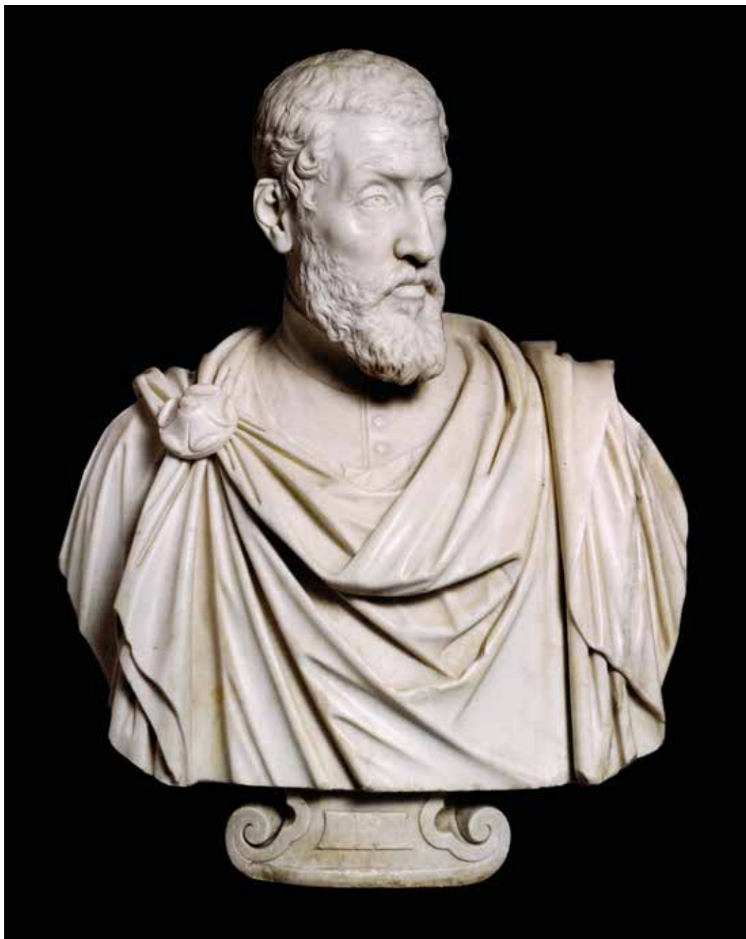
6. Padova, Museo Civico, Alessandro Vittoria, Busto di Orsato Giustiniani , c. 1580.