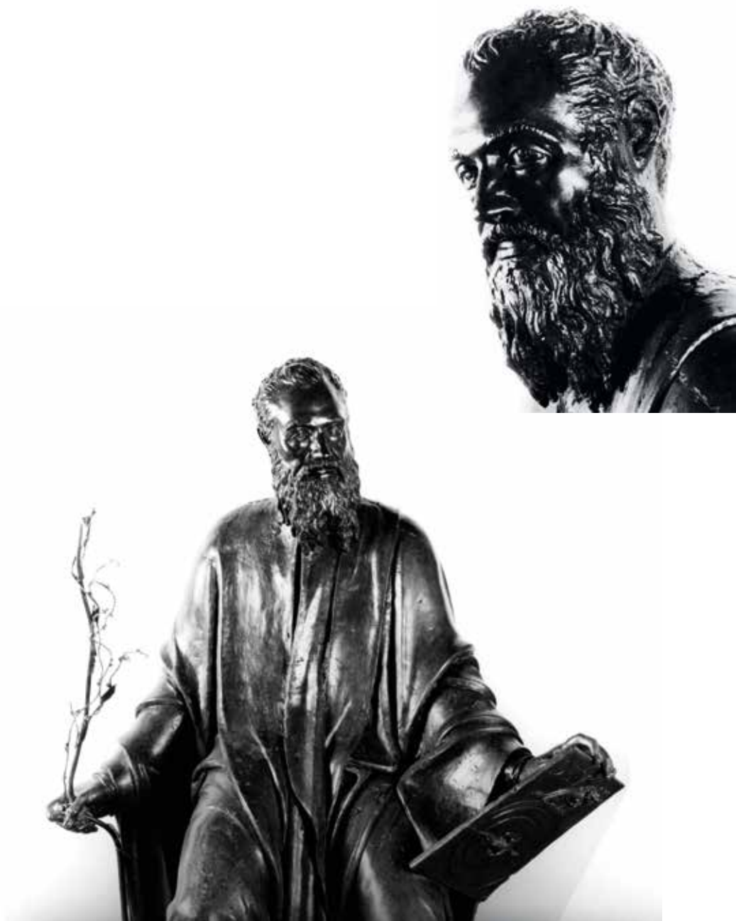
1. Venezia, Jacopo Sansovino, Facciata della chiesa di San Zulian , 1553-57