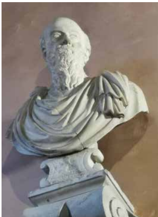
5. Venezia, Chiesa di Santo Stefano, Anonimo, replica del busto sul monumento funebre di Giambattista Ferretti , circa 1744.